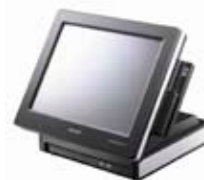
POS & Kvittoskrivare