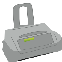
Kompakt telefax Home & Office