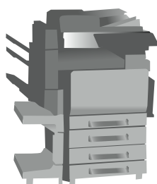
Office multifunktions- system i färg och svartvitt