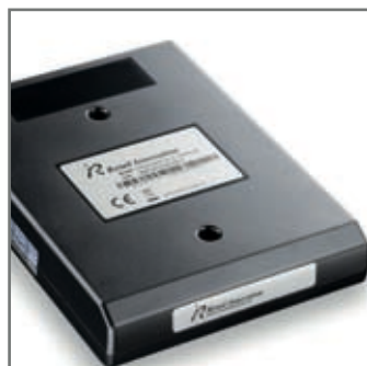
CLEAN CASH UNIT för den nya kontanthanteringslagen.