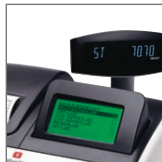
STOR GRAFISK OPERATÖRS DISPLAY