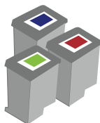
Förbrukningsmaterial & datortillbehör