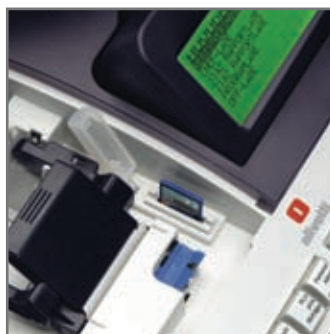
Plats för SD Minneskort