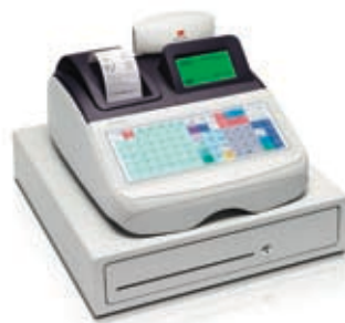
ECR 8220 sv