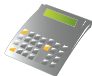
Bords- och fickräknare TA/Olivetti