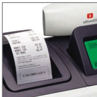
EXEMPEL PÅ KVITTO

ECR 8200 sv och 8220 sv klarar alla lagkrav som kommer att ställas från och med 1/1-2010. Kassaregistret skall anslutas till Retail Innovations Clean Cash kontrollenhet med certifikatnummer CU1001 för att bli ett certifierat kassaregister som följer lagen och ger dig och alla andra företagare möjlighet att konkurrera på lika villkor.