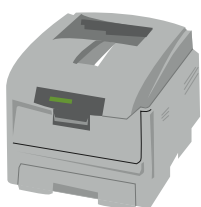
Office skrivare för färg och svartvitt