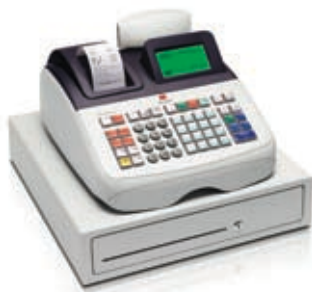
ECR 8200 sv